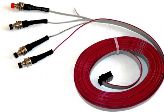
Рис.1 Кнопочный пульт

Подготовить 4 отверстия для кнопок в месте установки кнопок. Определить первую кнопку по красному проводу 1-2 жилы, затем кнопки идут по порядку жилы на шлейфе 3-4,5-6,7-8. Установить первую кнопку первой сверху для стелы, затем установить остальные кнопки по порядку в направлении в низ. Кнопки подключить в разъем (P1), указанный на рисунке 2.